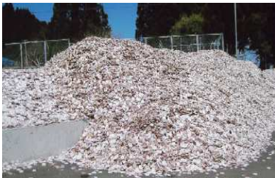
ホタテ貝殻堆積場